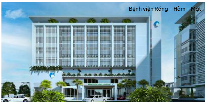
Bệnh viện Răng - Hàm - Mặt