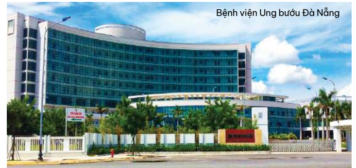
Bệnh viện Ung bướu Đà Nẵng