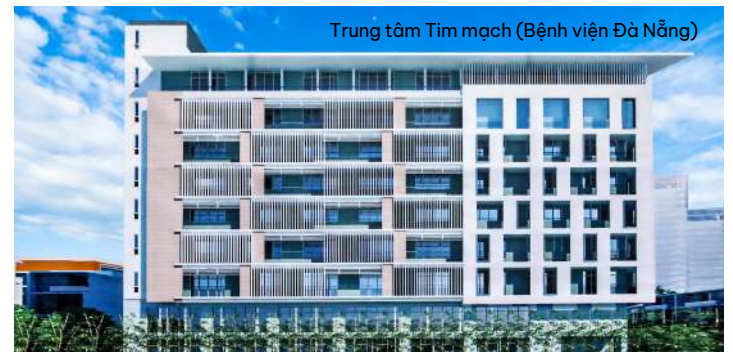
Trung tâm Tim mạch (Bệnh viện Đà Nẵng)