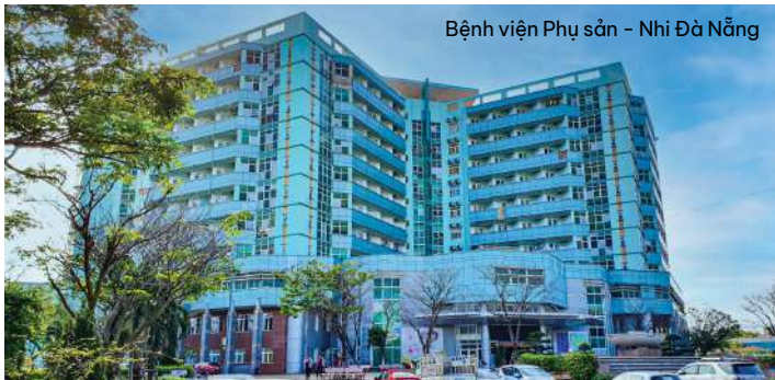
Bệnh viện Phụ sản - Nhi Đà Nẵng

(Thu nhập năm 2020 có xu hướng giảm do tác động của đại dịch COVID-19)