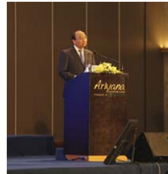
Thủ tướng Nguyễn Xuân Phúc phát biểu tại Diễn đàn Đầu tư Đà Nẵng 2017

đáp ứng yêu cầu của cuộc cách mạng công nghiệp 4.0. Thành phố cần phối hợp chặt chẽ với các địa phương trong khu vực, đặc biệt là vùng kinh tế trọng điểm miền Trung, trong hoạch định định hướng và chính sách phát triển KT-XH của khu vực và từng địa phương.